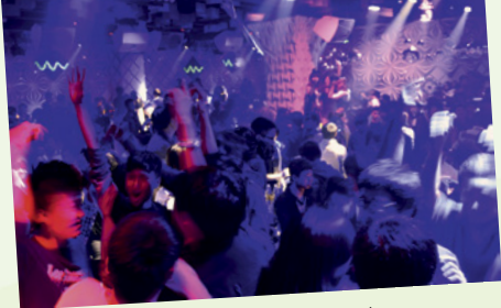
Konzerte, kulturelle Angebote und durchtanzte Nächte