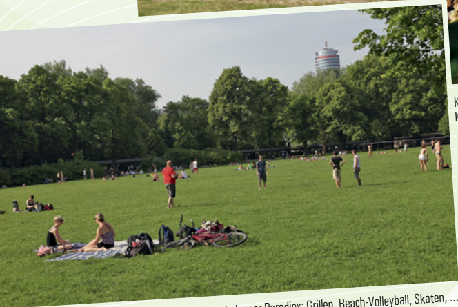
Stadtpark Jenaer Paradies: Grillen, Beach-Volleyball, Skaten, ...