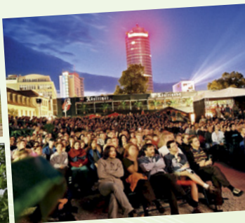
Kulturarena: Konzerte und OpenAir-Kino im Sommer